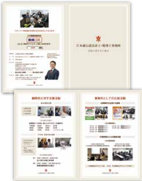
江本誠公認会計士・税理士事務所で大活躍のツール

『私の経験から不動産会社様のツールを持参し事前にアポを取ってシニアの方にご訪問すればいろいろ課題が探り出せます。個別に各社が掲げていらっしゃるキーワードもあると思いますので、可能であれば次回各社パンフを持ち寄ってはいかががでしょうか!』